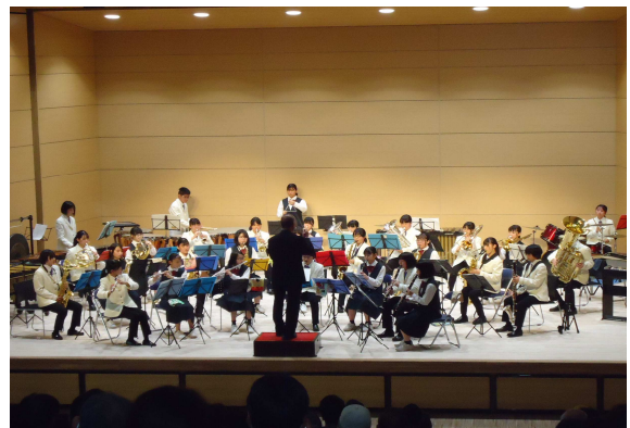
吉舎中学校・日彰館高校吹奏楽部の合同演奏 (よっしゃ吉舎ホール)