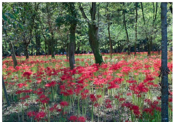
八幡辻ヒガンバナ群生地