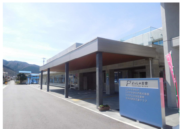
拠点施設 よっしゃ吉舎

吉舎町自治振興連合会は、地域コミュニティ活動において、「まちづくりビジョン」の具体施策の推進を図るため、住民自治の理念である「自分たちのまちは、自分たちで創る」気概のもと、各自治振興会の特色づくりと拠点機能の強化により、町民の皆さんが幸せを実感できる「持続可能なまちづくり」の機運の醸成に努めます。