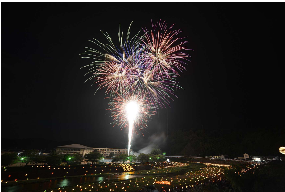
吉舎町の夏の風物詩「吉舎ふれあい祭り」