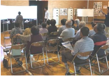
5月31日に徳市地区で実施された「交通安全・防犯教室」の様子

「現金送れ！」は詐欺！必ず誰かに相談しましょう。○交通事故被害防止のために反射材や明るい服の着用を！