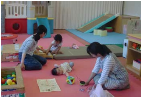
「みつばち」月～金曜日 朝9時～お昼3時 三良坂農村ふるさとセンター2階 保育士さんがいつでもおられます。