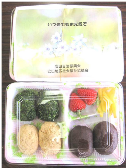
彩鮮やか三色おはぎ弁当

3月12日(日)安田地区福祉協議会・安田自治振興会共催による給食サービス事業の一環として安田地区在住の一人・二人暮らしの高齢者(80才以上)47名の方々に「おはぎ」弁当をつくり、配達させていただきました。「美味しかった」「ありがとう」の声が届きました。(溝上 洋)