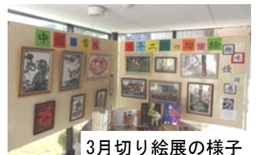
3月切り絵展の様子