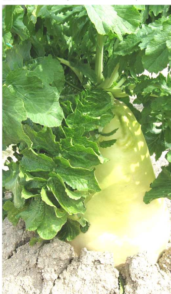
デカすぎるダイコン

中四字自治振興会では、3月20日(祝)役員24名で因島市の万田発酵(株)へ研修に行きました。訪れるとでっかいダイコンのオブジェに迎えられ、研修のスタートです。担当者の方の説明でまずは酵素の働き、酵素を使った作物の育て方などを話していただきました。みなさん農業、家庭菜園をされていることもあり興味津々?質問もたくさんされています。続いてびっくりファームの中を見学、普段目にするでもないデカすぎるダイコン、色鮮やかな花、年数物の葉牡丹などにびっくりポン!熟成室に並んだ樽の金額を聞いてポカッンと・・・。