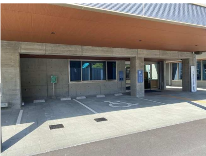
正面玄関横の思いやり駐車場 2台

現在、工事中でご迷惑をおかけしております。吉舎支所へお越しいただくときは、吉舎保健