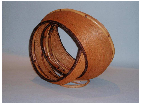
なみ 門田祐一 濤たちて