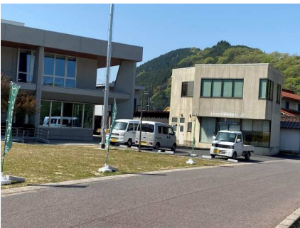
図書館前馬洗川側駐車場 4台