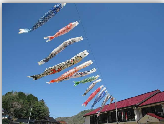
吉舎徳市自治交流センターの空で、鯉のぼりが気持ちよく泳いでいます。