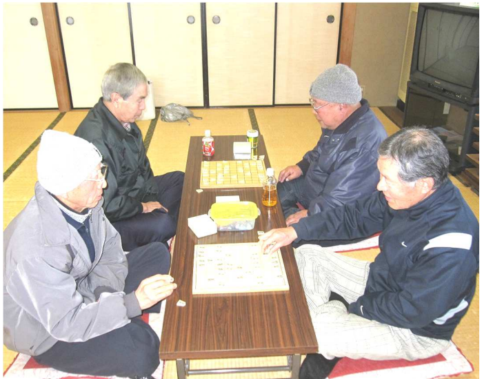
将棋教室のようす (吉舎地区からも参加されています。)

安田自治振興会では、「ふれあい教室」において各種のコミュニティ活動を行っています。多数の参加をお願いします。