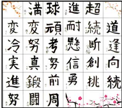
「3年生31名それぞれの「私の決意」の漢字一文字です」