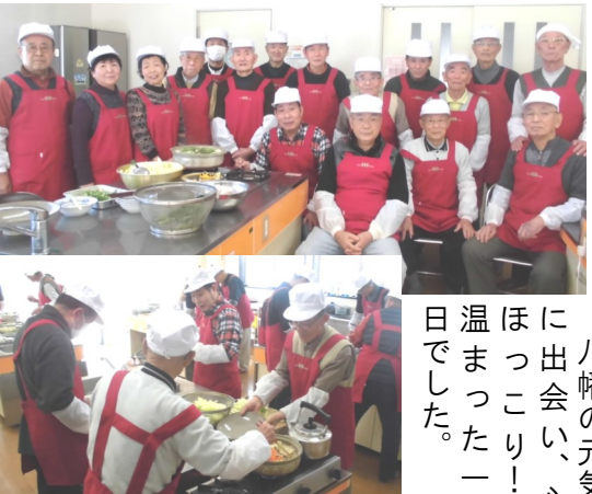
八幡男性料理教室は、毎月第3火曜日の9時半～(年9回)、八幡コミュニティセンターで開催。参加費は年間9千円。