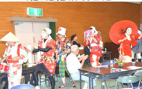
雲通区のちんどん屋一行