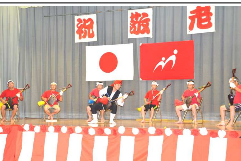
丸田・川之内区のスコップ三味線