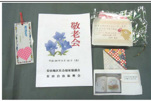
しおりと安田保育所、安田小学校の子どもたちから