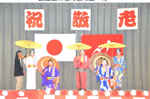
清綱区の清綱五人衆