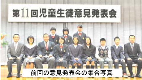
第11回児童生徒意見発表会

これからもおぼつかない歩みながら、吉舎町の子ども達がのびのびと育っていく環境作りを目指し様々な取り組みを展開して参りますので、温かいご支援をよろしく願います。