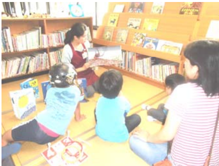
熱心に目と耳を傾ける子どもたち