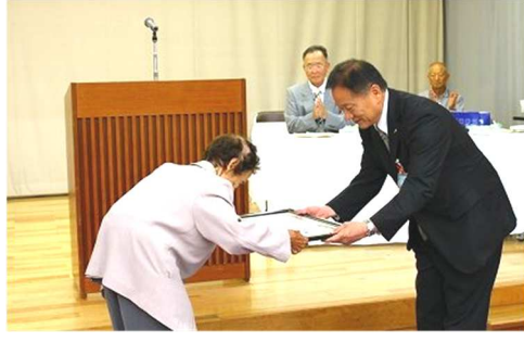
三次市からの米寿祝賀です