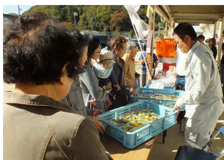
お待たせ!美味しいよ!!