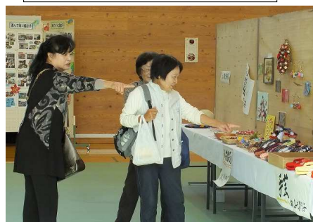
観て、みて!いいねえ!