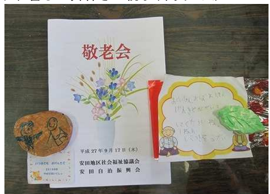
小学校・保育所からの記念品