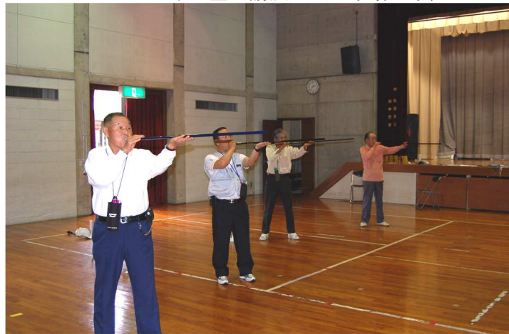
スポーツ吹矢クラブ