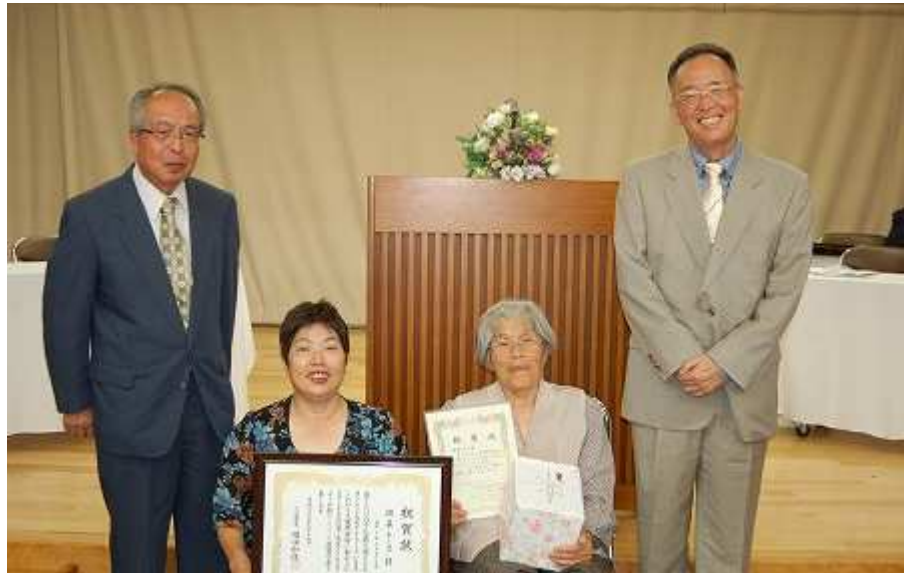
米寿を迎えられ、喜びの掛森さん親子(中央二人)

9月17日(木)安田地区社会福祉協議会の主催で「君田温泉 森の泉」において敬老会を行いました。 今年の安田地区の敬老会対象者は昭和14年9月30日までに生まれた人(満76歳以上)で、158名(男性56名、女性102名)おられます。このうち21名の方がご出席くださいました。 ゆつくりとお湯につかり、リラックステして過ごされました。会食時には「お楽しみ抽選会」を楽しんでもらったり、普段は会う機会が少ない人たちとの交流を深めておられました。 また、米寿祝賀者は7名で代表者の方へ三次市と安田地区社会福祉協議会からそれぞれ祝賀状と記念品が手渡されました。おめでとうございます。 (溝上 洋)