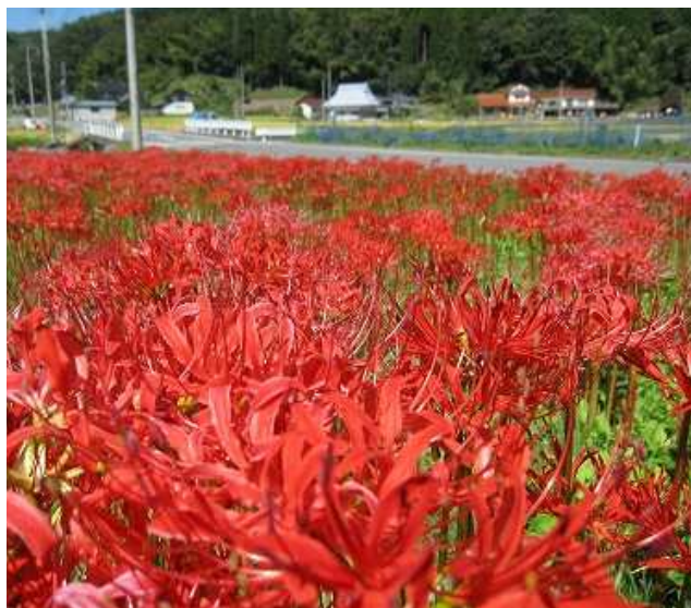
9月20日(日)一面に咲き誇る彼岸花を撮影し ました。 何とも言えない複雑な花びら・まっ赤な色、 いつも不思議に感じて見入ってしまいます。