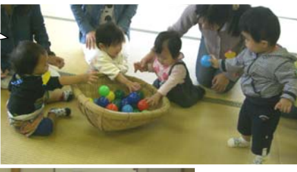
そうきに玉入れ♪まん丸ボールを上手につかむよ^^