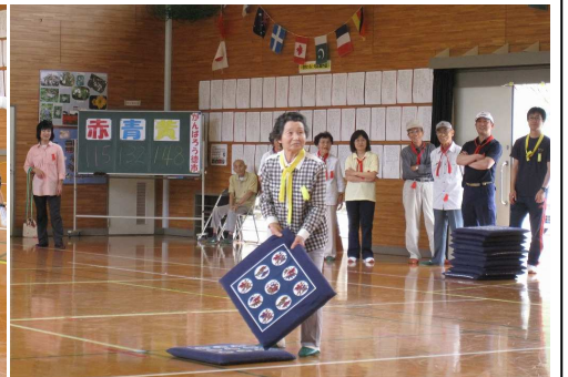
ざぶとん飛ばし競争