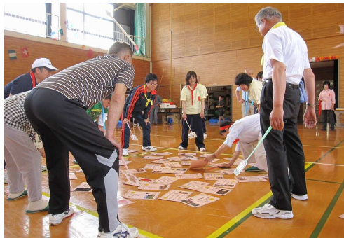
徳市かるた取り競争