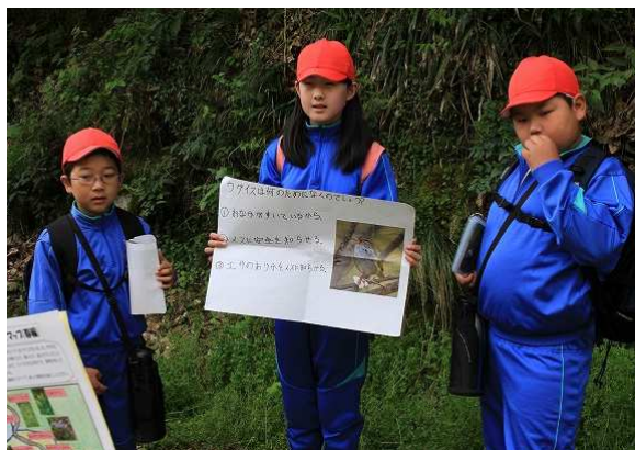
ウグイスのクイズ出題中

4月28日(火)安田小学校独自で自慢の取り組みである、児童による本年度第1回「安田子ども自然ガイド」が開催されました。