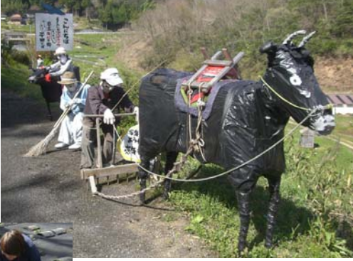
この中に一人だけ本物の人物が。。。わかりますか？ あとは全てかかしです。

次々新しいかかしがデビューするだけでなく、季節によって少しずつ変化。一年中楽しめるスポットです。