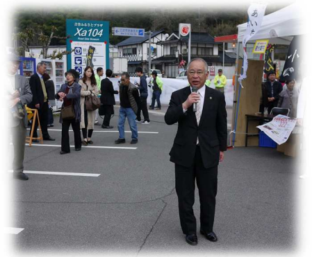
増田市長も駆けつけてくださいました