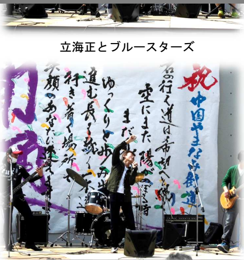
立海正とブルースターズ