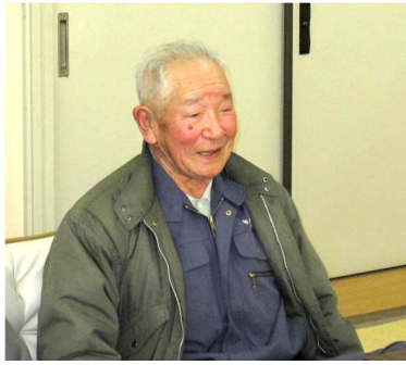
91歳医者いらずの丈夫な体と 明るい心の持ち主です

かれた白い紙のみ。 この悲惨な歴史の事実を学習することにより、二度とこのようなことのない地域社会が築けるよう、戦没者の方々へ鎮魂の祈りを捧げてきた2年間でした。新年度から第二期が始まります。世話役は変わりますが、たくさんの方々のご参加をいただき第一期同様活発な議論をしていただきますようお願いいたします。 (野曾原 暢)