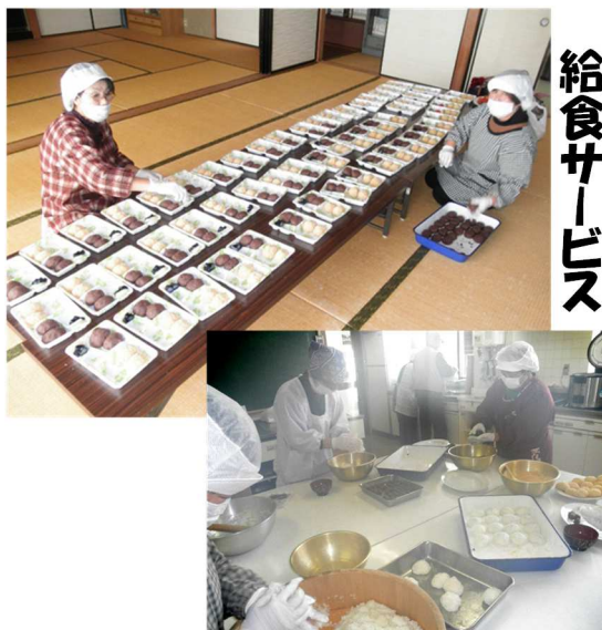
気持ちを込めて作ります

3月15日(日)、安田地区社会福祉協議会・安田自治振興会共催による給食サービス事業の一環として安田地区在住の一人・二人暮らしの高齢者(80才以上)42名の方に恒例の「おはぎ」弁当をつくり配達させていただきました。 三色おはぎ(海苔、あんこ、きな粉)と真っ赤ないちご、黄色のたくあん、彩も鮮やかに。「美味しかったよ」という喜びの声も届きました。スタッフのみなさん、お疲れ様でした。