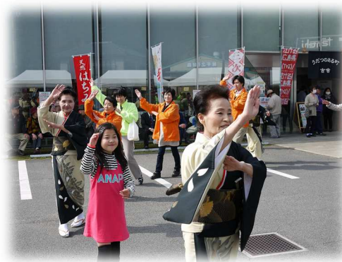
みんなで「吉舎音頭」を踊りました