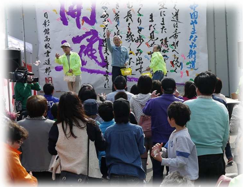
最後は福入り餅まき