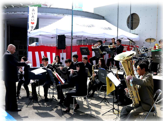
ザ・クラウディーズ