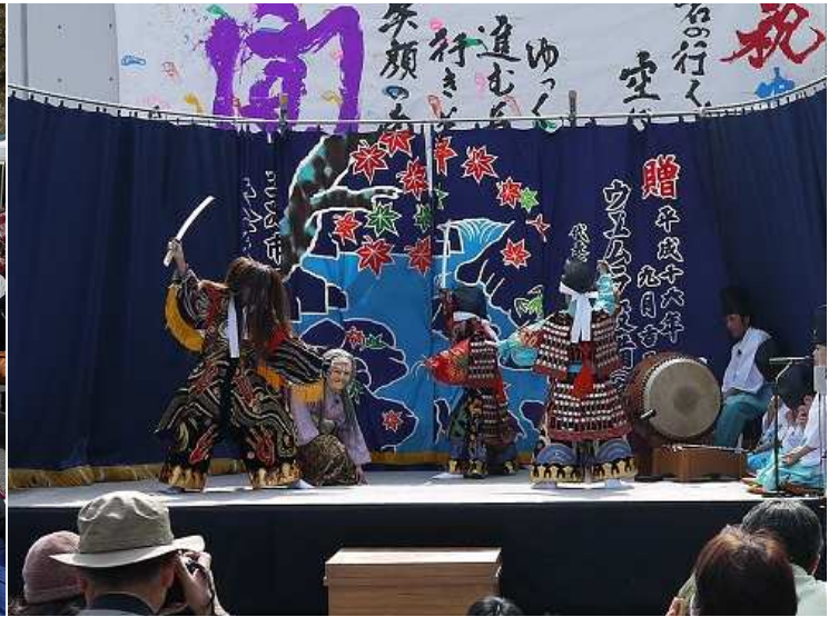
お待ちかねの神楽を大勢の方に観覧いただきました