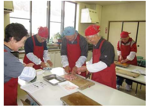
「いいロース肉じゃね」