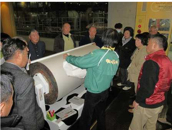
新聞用紙は約1.4ト（お相撲さん約10人分）