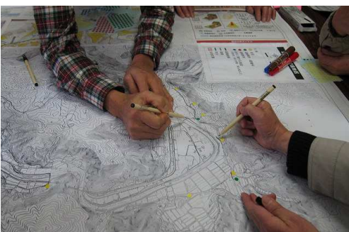
避難路書き込み中

2月5日(木)安田コミュニティセンターで上安田地区ハザードマップ作成説明会が開催され大勢の方が集まってくださいました。クイズ形式で土砂災害について学習したり、2班に分かれて地元の白地図を使ったワークシヨップ。地図に自宅、避難場所、避難経路等を書き込み、確認。危険箇所、地域の問題点等を話し合いました。「これを参考に、地域でいかに安全円滑に避難できるか等を話し合う必要がある」「互助しなければ」等の意見がありました。(溝上 洋)