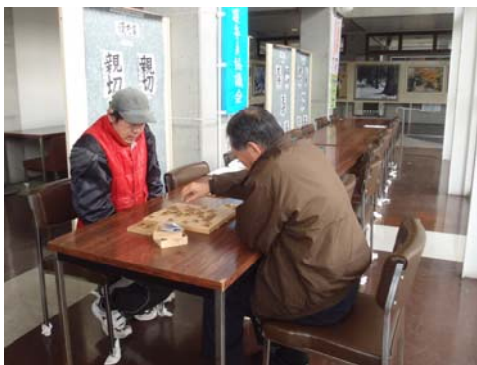
毎週月曜日の10時～12時 吉舎生涯学習センターで。 将棋経験者の方、お待ちしております!