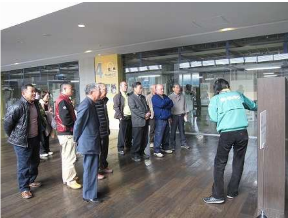
クイズ形式の新聞内容の説明