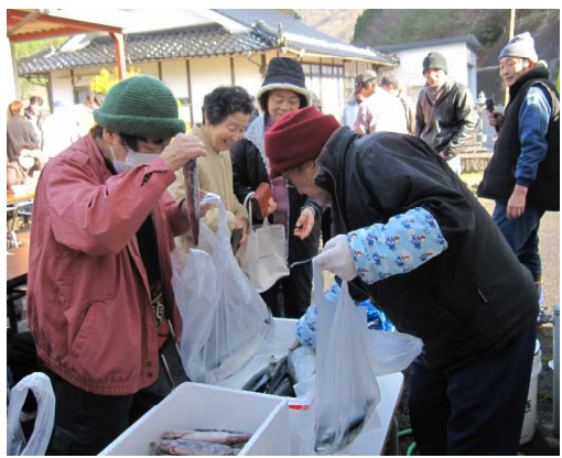
第11回目となりました

12月7日(日)10時より徳市ふれあいセンターにて開催されました。 鮮魚・野菜・加工品の販売や青年によるバザー・女性部のうどんなど、いつも好評で完売。 野菜の重さ当てクイズ・ユニークな形の山の芋の重さ当てクイズでは、自分の感を確信して投票されていました。 寒い日ではあったけれど、恒例の100円クジで盛り上がり、おもてなし豚汁でお腹も心も温まり、笑い声の絶えないイベントでした。 (中倉 政子)