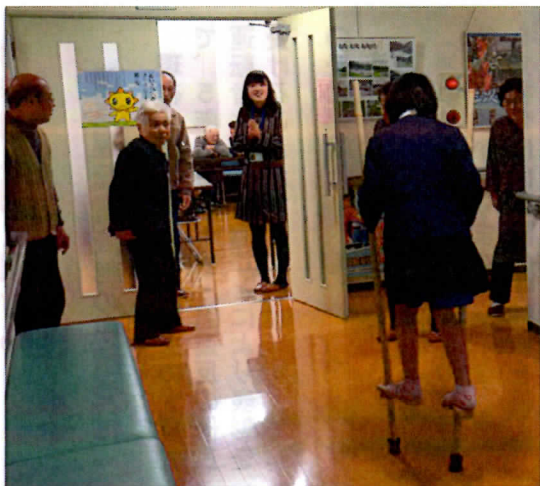
じょうずに竹つまに乘れました。