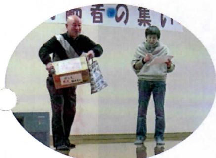
スタッフによる寸劇