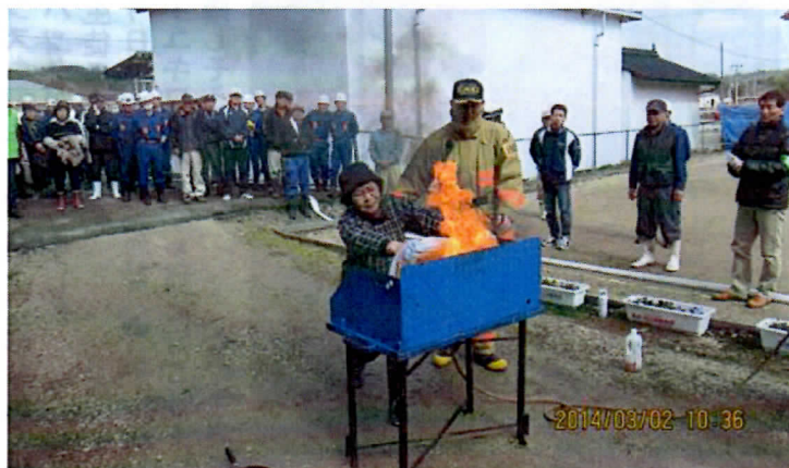
濡れたタオルをかけて消火!