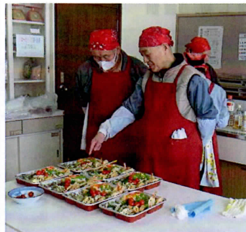
これ、美味しそうだね。

「今日のできは最高だ、今から花見だ！ユキワリイチゲを観に行こう！」と嬉しそうでした。(溝上 洋)