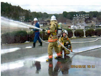
備北消防による救護活動