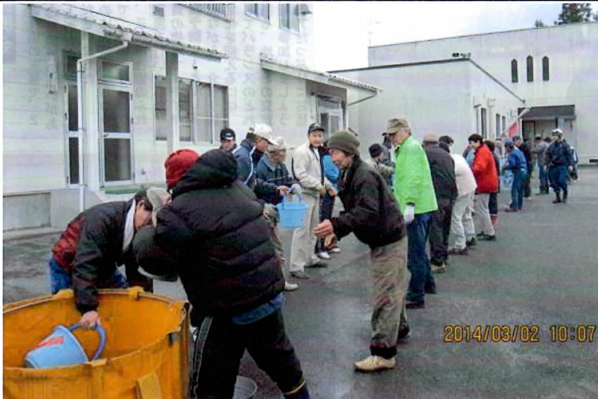
地域住民によるバケツリレー消火