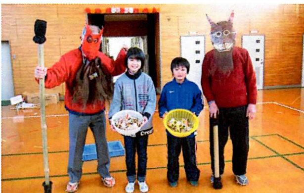
やさしい鬼さんと記念撮影