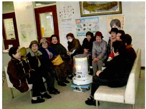
（左より右へ）おしゃべり

ここでは自然に顔がほころんで、お互いの「元気のおすそわけ」の場になっているようでした。