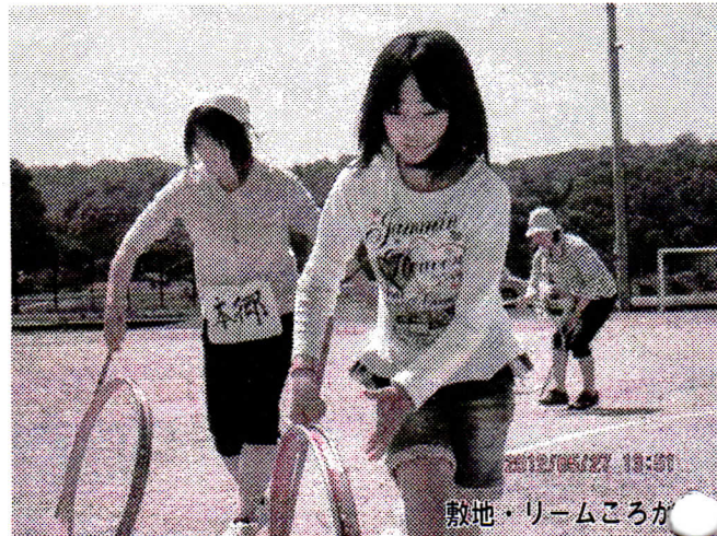
敷地・リムころが