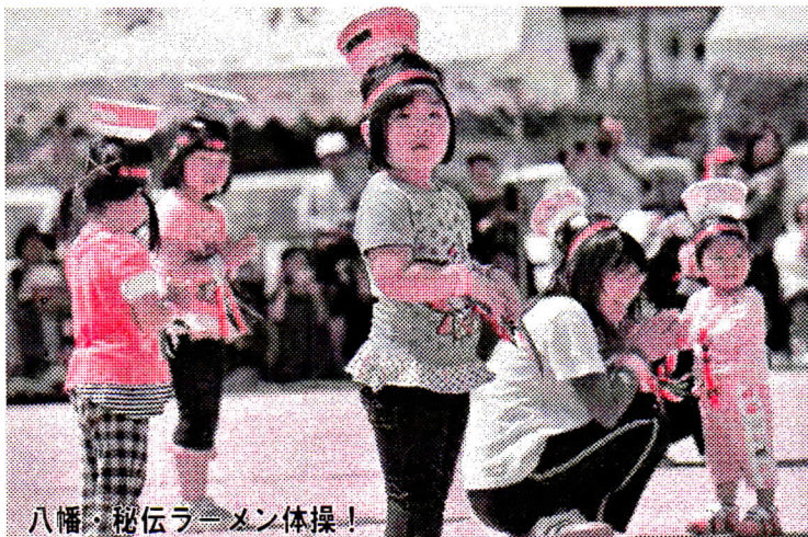
八幡・秘伝ラメン体操!