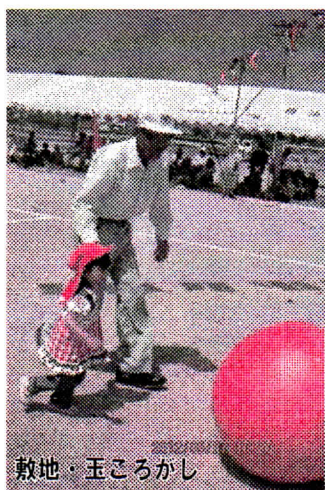
敷地・玉ころかし