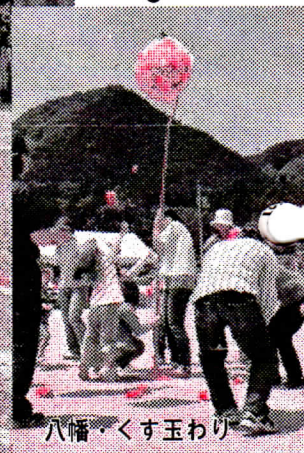
八幡・くす玉わり