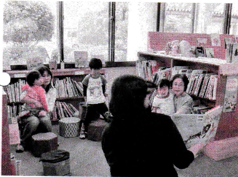
「りんく」さんの力を借りての、おはなし広場です。