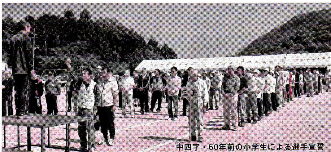
中四字・60年前の小学生による選手宣誓