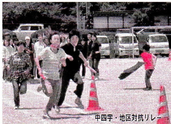
中四字・地区対抗リレー