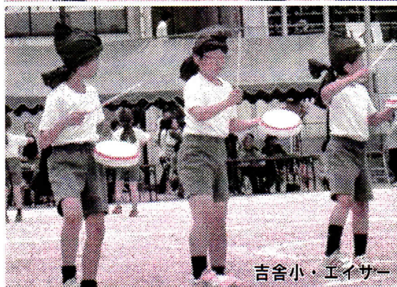
吉舎小・エイサー