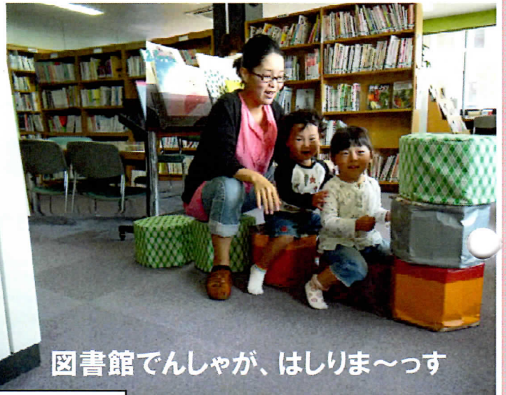
図書館でんしゃが、はしりま〜っす