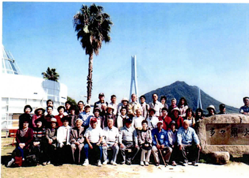
しまなみ街道ウオーキング多々羅大橋

中四字自治振興会では、10月16日(日)朝8時にコミュニティセンターを、バスに乗って44名の皆さんが、しまなみ街道に向けて出発されました。瀬戸内の海が見え始めると大歓声、山育ちの私にとっては、海は生まれる前のふるさと、母のお腹の中と同じ思いがして懐かしく幸せを感じます。 瀬戸田PAにて休憩の後ウオーキング開始、約1時間を掛けて多々羅大橋経由大三島しまなみ公園までの約4キロを歩く中、大橋の上は風が強く声を掛け合って帽子を抑えながら歩きました。