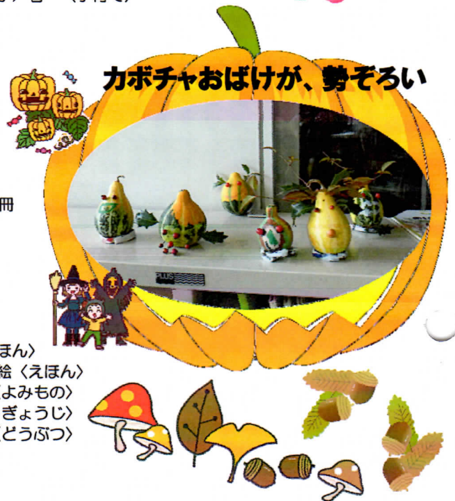
カボチャおぼけが、勢ぞろい